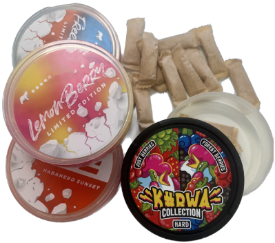
Sachets de nicotine dont la vente est actuellement autorisée aux mineurs.

Le cas des sachets de nicotine illustre le besoin d'une réglementation relative aux produits de la nicotine pure. Ces derniers prennent la forme de petits sachets à mettre sur les muqueuses, il commence d'ailleurs à rencontrer un succès certain chez les mineurs dans les autres pays occidentaux. Ne rentrant ni dans la catégorie des produits du tabac, ni du vapotage, la vente aux mineurs est par conséquent autorisée et le produit peut être commercialisé n'importe où. Il s'agit pourtant d'un produit contenant de la nicotine, molécule qui génère une addiction.